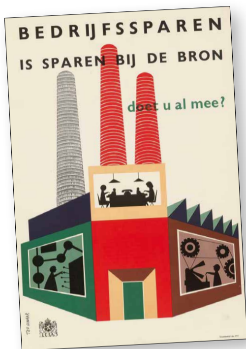
1950. In de linker onderhoek het gestileerde rijkswapen met de twee leeuwen dat de RPS als logo voerde, met uitsnede ervan.

Van 7 februari tot 20 mei heb ik stage gelopen bij het Historisch Bedrijfsarchief van de ING. Als onderdeel van deze stage heb ik onderzoek gedaan naar de ontwikkeling van huisstijlen van de ING en haar rechtsvoorgangers door de jaren heen. Een huisstijl bestaat uit beeldkenmerken waaraan een bepaald bedrijf herkend kan worden zoals kleur, logo en tekst. In dit artikel deel ik mijn bevindingen over het gebruik van de ING-leeuw als logo op affiches.