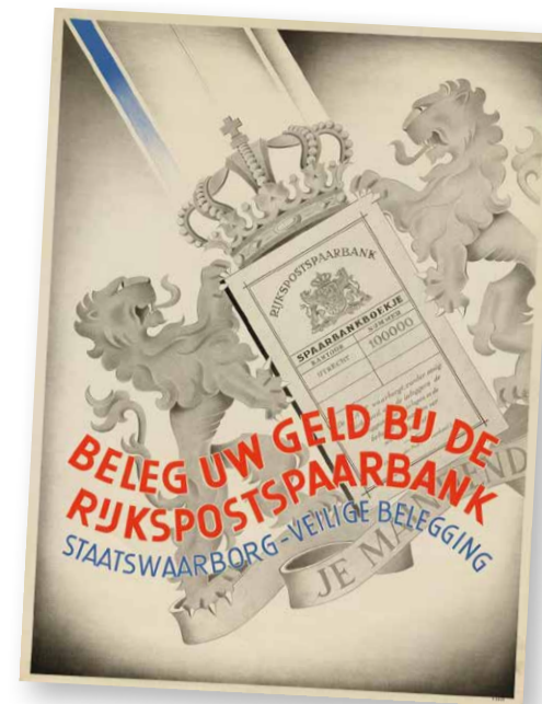
1942. Affiche RPS. Twee heraldische leeuwen met een schild geven aan dat de RPS een rijksinstelling is.

Styling van het logo van de RPS gebeurt geleidelijk en in 1950, in een affiche over bedrijfssparen, is voor het eerst de vorm van de twee leeuwen te zien die tot het einde van de RPS wordt gebruikt. Hiermee gaat de RPS mee in de trend die rond 1960 opkomt in Nederland om een vast logo te gebruiken waaraan klanten een bedrijf kunnen herkennen. In 1977 vormt de RPS samen met de Postcheque- en Giro-dienst de Postgiro-RPS, die een zittende leeuw als logo gebruikt. Deze leeuw verandert nog wel eens van uiterlijk en afhankelijk van het affiche is hij soms helemaal niet aanwezig. De Postbank, die in 1986 door de Postgiro-RPS wordt opgericht, is veel consequenter in het toepassen van het logo, een liggende leeuw. Dit nieuwe logo en de bijbehorende huisstijl,