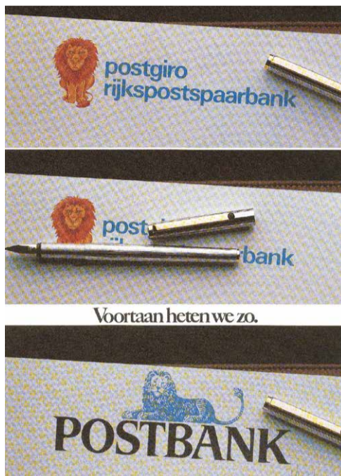
1986. De zittende leeuw van de Postgiro-Rijkspostspaarbank wordt vervangen door de liggende leeuw van de Postbank.

De leeuw werd voor het eerst gebruikt door de Rijkspostspaarbank en wordt nu nog gebruikt als logo van de ING. De Rijkspostspaarbank gebruikte het rijkswapen met twee heraldische leeuwen al vanaf de oprichting in 1881. Maar bijna alle affiches van vóór 1900 zijn typografisch, waarbij tekstuele inhoud belangrijker is dan voorstelling. Afbeelding 1 is een van de eerste grafische affiches van de RPS in de collectie, uit