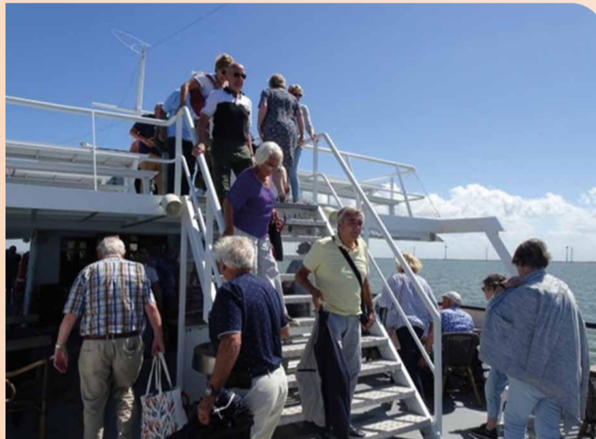
Fantastisch weer om aan dek te zitten.

Deze dag vraagt zeker om herhaling. Dan niet zoals in 2019 naar Hindeloopen of deze keer naar Lemmer, maar waarschijnlijk naar Kampen. Een dag varen in 2023 is bij de